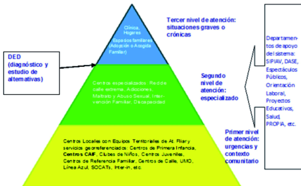
Cuadro 1: Niveles de complejidad en la estructura de INAU. Gil, A. Machado, G. y Antelo, E. (2011)

En un tercer nivel , se atienden las situaciones graves o crónicas altamente complejas donde los derechos vulnerados hacen necesaria la separación del entorno familiar.