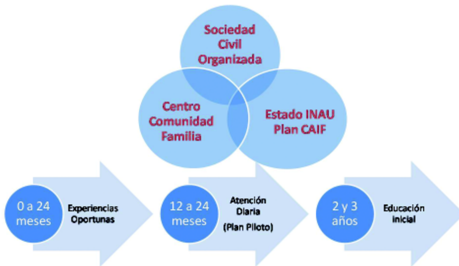
Cuadro 3: Modelo institucional del Plan CAIF. Gil, 2014.